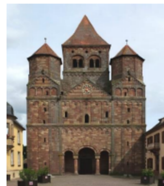
Westfassade der Abteikirche

Diese Veranstaltung ist nicht barrierefrei. Die Mindestteilnehmerzahl liegt bei 35 Personen.