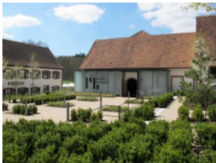
Musée Lalique, Vorplatz-Seite

Am 25.05.2024 geht es ins Bucklige Elsaß (Abfahrt per Bus voraussichtlich 08:00 Uhr am Trierer Hbf).